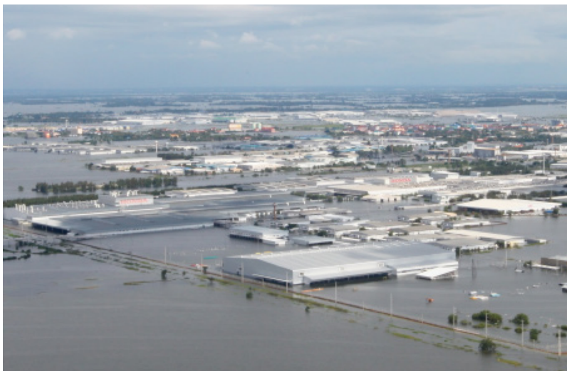
Overstroming van de Honda fabrieken in Rojana Industrial Estate nabij Bangkok. Deze lagen tot maanden na de overstroming stil.

Tot slot zijn er maatschappelijke en politieke afwegingen die invloed kunnen hebben op de aanwending van schaarse middelen. Een voorkeur voor gevolgbeperking kan worden gemotiveerd op basis van de maatschappelijke impact van grote rampen (risico aversie). Ook kunnen er grote aanvullende baten ontstaan door het combineren van meerdere opgaven, het zogenaamde "meekoppelen". Denk hierbij aan de effecten op de natuur van Ruimte voor de Rivier. Echter, ook dan blijft het van belang om de kosten en baten inzichtelijk te maken zodat er juiste afweging kan worden gemaakt.