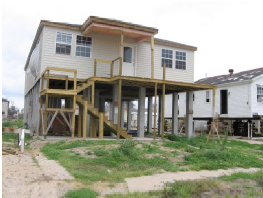
Afschuiving van een dijk in de 17th Street Canal in New Orleans bij orkaan Katrina.